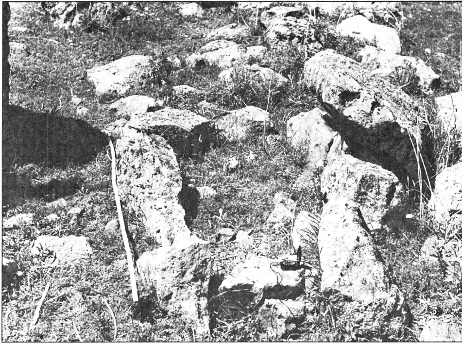
یکی از قبور تاریخی احتمالاً مربوط به هزاره اول ق.م در چهریق